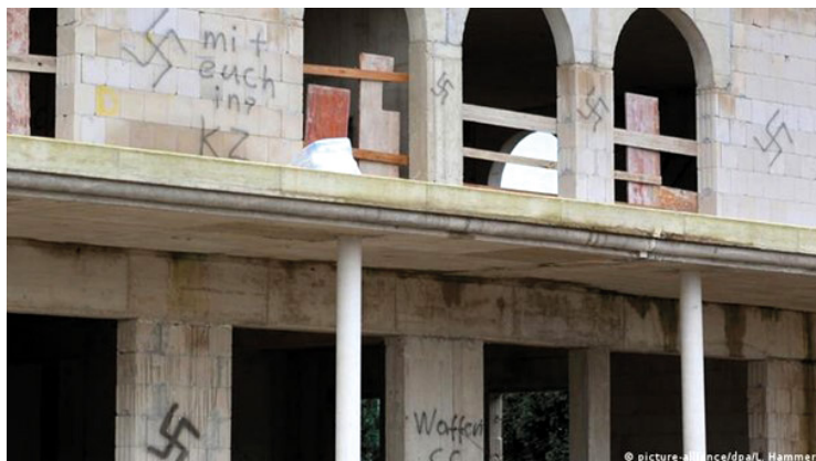
Swastyki i antymuzułmańskie hasła na murach meczetu budowanego w Dormagen; https://www.dw.com/pl/niemcy-ataki-na-muzu%C5%82man%C3%B3w-w-2017-roku/a-42811457

W tymże roku odnotowano ok. 950 ataków na muzułmanów, ich świątynie bądź instytucje. Ataków na meczety było 60. Raniono 33 osoby 298 .