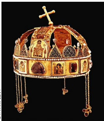
Korona Św. Stefana

rozmowę zarówno z polskimi, jak i z węgierskimi wystannikami. Ci mieli pod żadnym pozorem nie dopuścić do zwaśnienia między narodem polskim a węgierskim (a już na pewno nie z powodu korony, zwaną później Koroną św. Stefana i symbolizującą jedność Węgier) a także pozostawać ze sobą w stosunkach braterskich! Nic dziwnego więc w używaniu w stosunku do naszych południowych przyjaciół słowa bratankowie .