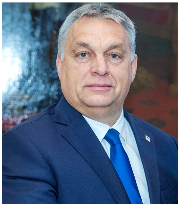
Viktor Orbán, premier Węgier

Lata 2015-2023 przypadają na rządy Prawa i Sprawiedliwości po stronie polskiej oraz na trzeci, czwarty oraz piąty gabinet Viktora Orbana (Fidesz) po stronie węgierskiej. Należy zaznaczyć, że obie te partie znajdują się politycznie po stronie umiarkowanej prawicy narodowo-konserwatywnej oraz wykazywały tendencje eurorealistyczne. Zarówno rząd węgierski, jak i polski narażały się opinii publicznej a w wypadku konfrontacji z komisją europejską potrafiły ramię w ramię wspierać swoje interesy. Eurosceptyzm Fideszu wynika z retoryki nemzeti erdek 3 , czyli stawiania w centrum polityki zagranicznej Węgier interesu narodowego kraju oraz sprzeciwu wobec niekontrolowanej imigracji z krajów muzułmańskich, co z kolei wynika z nacisku na chrześcijańskie dziedzictwo Europy, a co za tym idzie Węgier 4 . Konserwatyzm obecny w polskiej polityce ostatnich ośmiu lat wynika zarówno ze sprzeciwu wobec relokacji imigrantów w Polsce, kwestii uznania suwerenności Polski, jak i z katolickiego dziedzictwa naszego kraju. Nie ulega