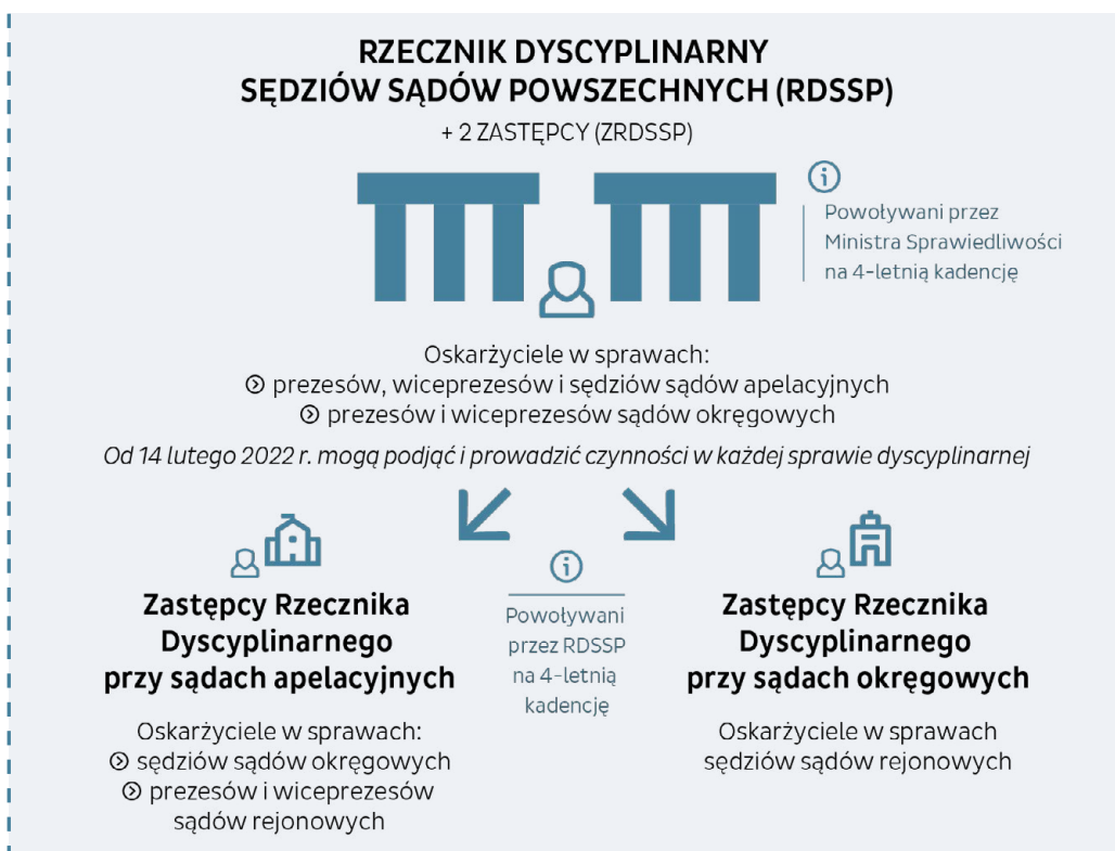
Schemat 2. Oskarżyciele przed sądami dyscyplinarnymi – rzecznicy dyscyplinarni

Wraz z wejściem w życie nowelizacji p.u.s.p. w kwietniu 2018 r. utworzona została funkcja Rzecznika Dyscyplinarnego Sędziów Sądów Powszechnych (RDSSP) oraz dwóch Zastępców Rzecznika Dyscyplinarnego Sędziów Sądów Powszechnych (ZRDSSP) 39 , powoływanych przez Ministra Sprawiedliwości na czteroletnią kadencję. Obok nich funkcjonują również zastępcy rzecznika dyscyplinarnego działający przy sądach apelacyjnych i zastępcy rzecznika dyscyplinarnego działający przy sądach okręgowych 40 . Pełnią oni również czteroletnią kadencję, z tym, że powoływani są przez Rzecznika Dyscyplinarnego Sędziów Sądów Powszechnych spośród sędziów danego sądu lub sądów okręgowych (w przypadku rzecznika przy sądzie apelacyjnym) danej apelacji sądowej albo rejonowych (w przypadku rzecznika przy sądzie okręgowym) danego okręgu sądowego.